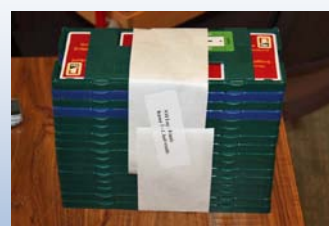
Forsegling på spilla finner du IKKE overalt i Norge.