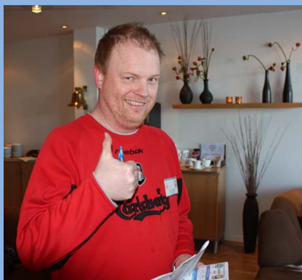
Har Ragnar kontroll på feltet?