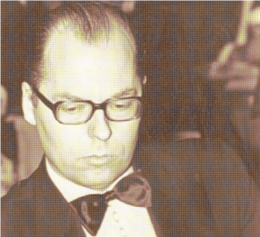
fra storhetstiden på 70-tallet..

Jeg tror nok at du kan lære mye, men for å bli en virkelig god spiller, må du også ha forståelse for spillet (talent).