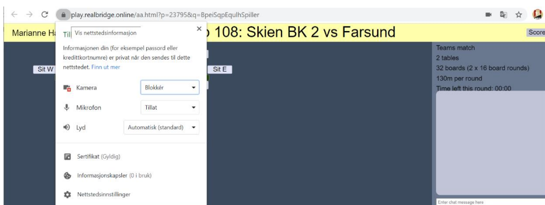
Figur 6: Hos denne spilleren er kamera blokkert. Endre til «Tillat», og klikk ctr+F5. Da har du først rettet opp innstillingene, og så tømmer du opp minnet til nettleseren. Etter å ha gjort dette må du logge inn på nytt.

Alle spillere må teste lyd og bilde i GOD tid før kampdagen. Om dere har problemer, ta kontakt i god tid, så vil vi hjelpe dere å feilsøke problemet, og om nødvendig koble inn teknisk avdeling hos RealBridge.