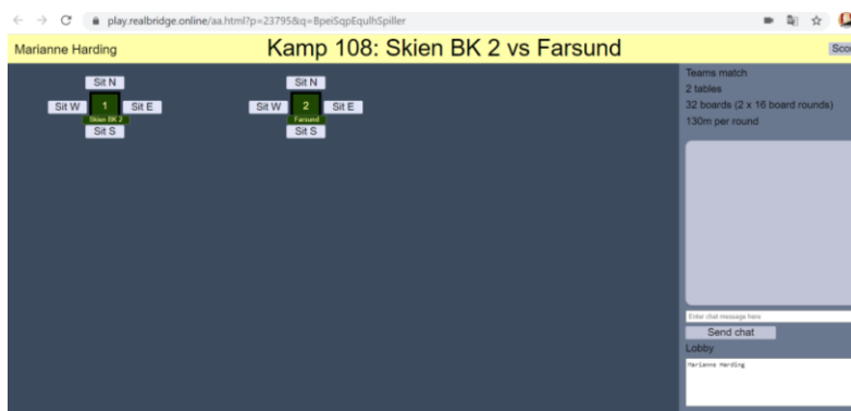
Figur 3: Hjemmebord og bortebord. Før kampstart, setter lagene seg sammen med sitt eget lag.

Nei. Dere får en lenke dere må klikke på, og så setter man seg ned sammen med laget sitt. Klikk på et ledig sete (N,S,Ø,V) der lagnavnet ditt står.