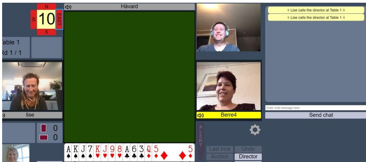
Figur 4: Video og lyd. Man kan se og høre de andre spillerne. Bruk gjerne et vanlig headset som følger med mobiltelefonen for å være sikker på at ikke mikrofonen fanger opp utgående lyd fra de andre slik at dere får ubehagelig feedback. Ser du høyttaler-symbolet til venstre for Berre4? Alle spillerne har et slikt symbol ved sitt navn, og der kan du stille ut-lyden fra hver av spillerne individuelt.

Her er det fire spillere samlet, som kan se og høre hverandre.