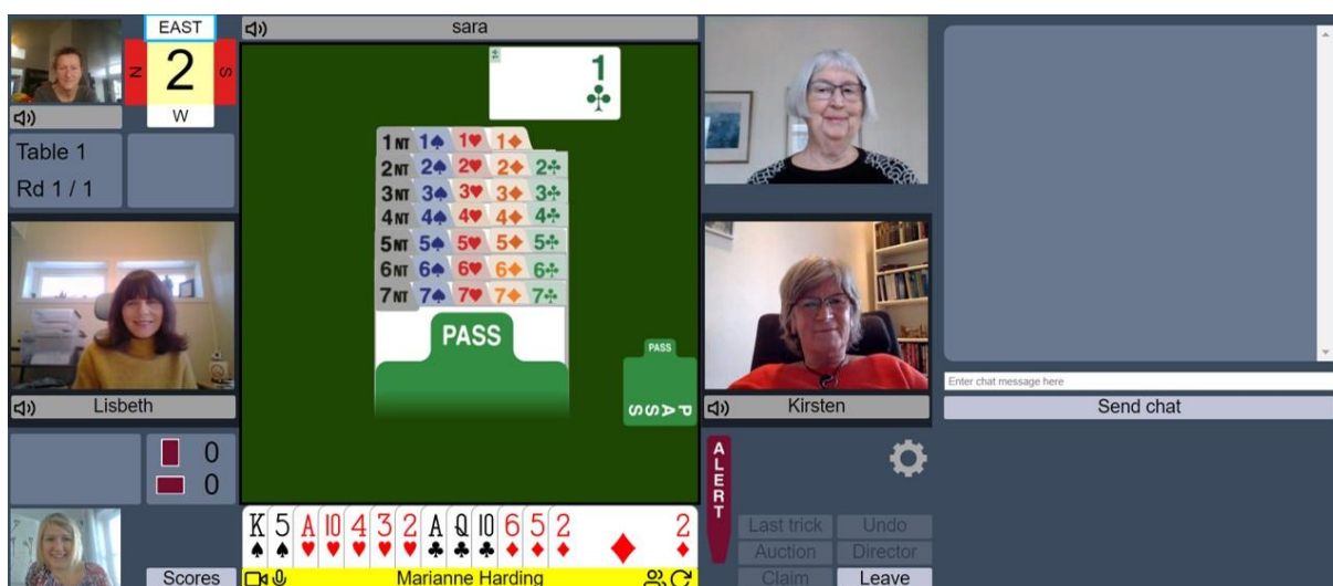
Figur 5: Reglene for annonsering og alertering er akkurat som i en vanlig «live» turnering.

Alle vanlige bridgeregler gjelder. Man skal annonsere hvor mange kort makkers åpningsmelding lover, og hva makkers meldinger på 2-trinnet betyr.