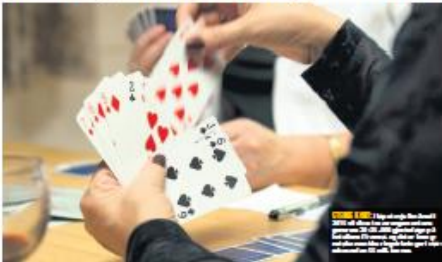
EM 2015 – I tillegg til åpnet EM (1.200-1.500 deltagere) og ungdoms EM (500 deltagere) vil det bli arrangert en deltagersammen gjennom 20-25 EM-gjennomføringer på høsten i Tromsø, og det er langvarig planlagt å arrangere arrangementer i samarbeid mellom 50 mill. kroner.