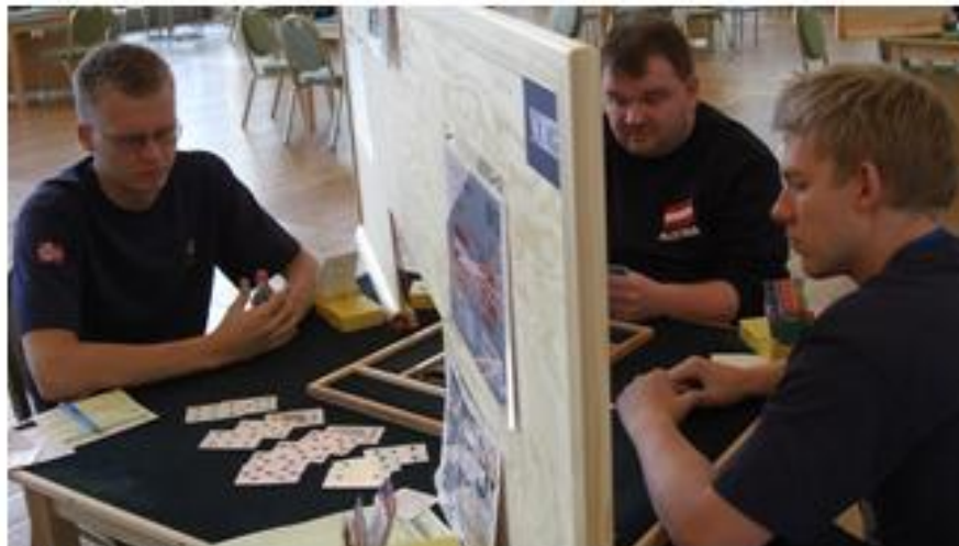
Norge i Bridge-EM i 2008.