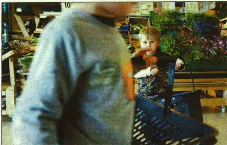
IKKE NØDVENDIG: Det er ikke nødvendig for mange barn å gå på allergi-diett.