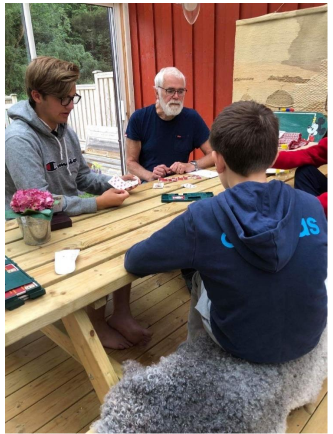
Alle hadde sin egen meldeboks og vi spilte med ferdigdublerte kort lånt fra Bjugn BK.