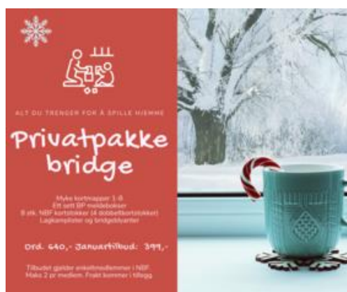
Figur 1.1 Eksempel månedlig medlemstilbud

Vi stilte oss spørsmålet, og svaret var at vi måtte gi et insentiv for å fortsette medlemskapet gjennom ei kommende tørketid. Ei liste over kommende månedlige supertilbud til bridgespilleren ble publisert, produkter som la til rette for bridgeaktiviteter innenfor hjemmets fire vegger. Eksempel: