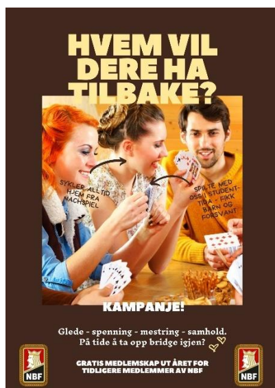
Figur 9.1 Eksempel plakat brukt i re-rekrutteringskampanje

Potensialet er at vi har hele 5421 tidligere medlemmer bare siden 2021.