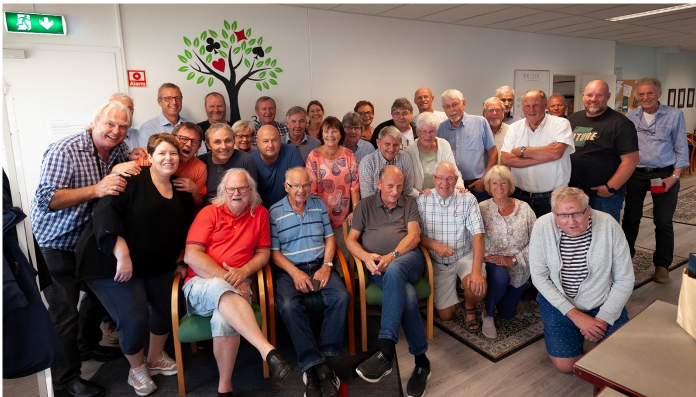
(Bridgebrøl fra Larvik BK)

Vi fikk med oss organisasjonen på en re-rekrutteringskampanje hvor man aktivt kontaktet tidligere medlemmer og inviterte dem tilbake i klubben. Vi sendte ut trivselspakker til klubbene med bridgekaffe og vaffelmiks. Vi synliggjorde klubbene som restartet med lagbilder på nettsidene av klubbens medlemmer, «bridgebrølet». Samlet sett tror vi disse og andre tiltak har hatt effekt. Likevel ser vi at flere klubber ikke har startet opp med livspilling igjen, og at det framover må jobbes målrettet for gjenstarte, bevare og øke aktiviteten ute i klubbene.