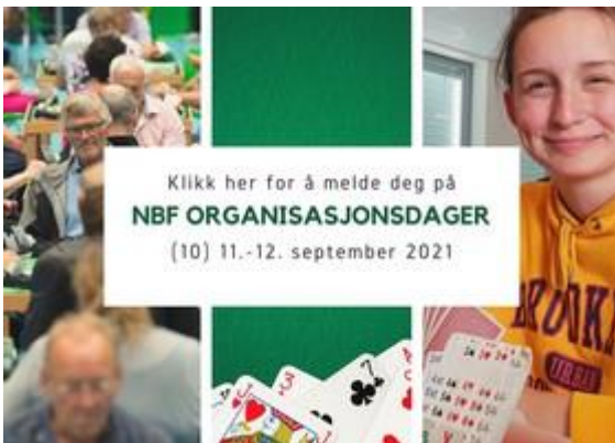
Figur 7.1 Toppbanner NBF organisasjonsdager