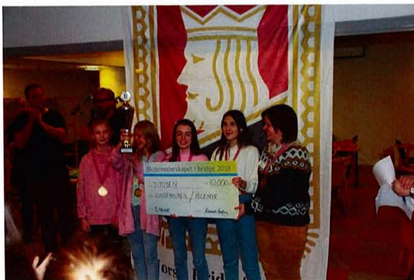
Vinnerlaget fra Iglemyr/Lundehaugen skole med vinnersekken på kr 10 000!