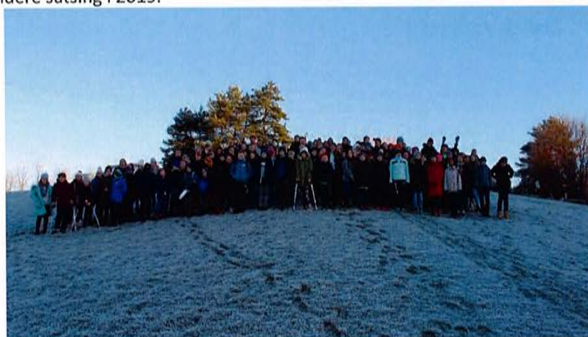
Alle spillere samlet utenfor Haraldsheim vandrerhjem

Prosjektet har gitt bridgen positiv medieomtale både lokalt og nasjonalt. Det er lagt et svært godt grunnlag for videre satsing i 2019.