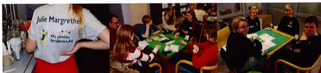
Os juniorbridgeklubb har egne T-skjorter – stor stemning på bordene under skolemesterskapet